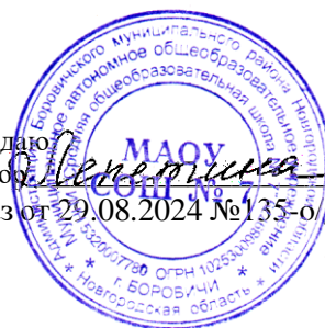
График проведения оценочных процедур в 2024/2025 учебном году в MAOU СОШ № 7