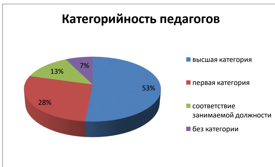
Диаграмма с характеристиками кадрового состава дошкольных подразделений